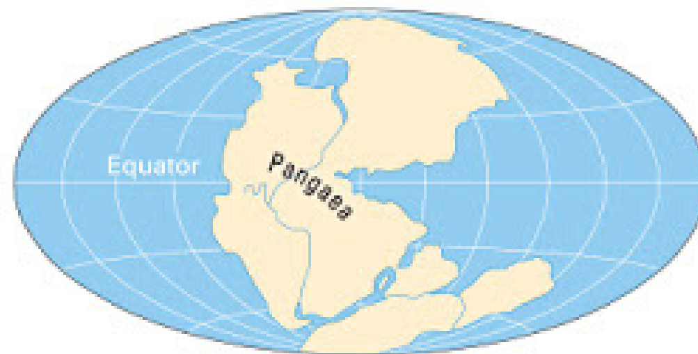
Tahap 1 : 225 juta tahun