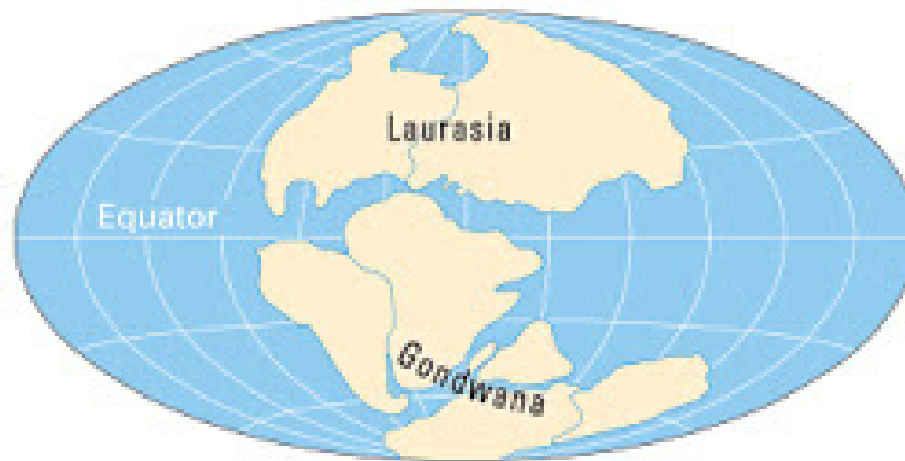
Tahap 2 : 180 juta tahun