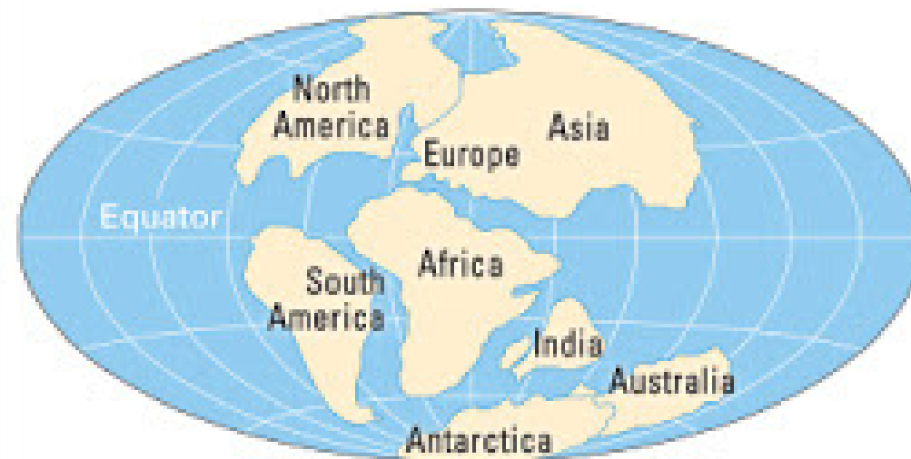
Tahap 3 : 135 juta tahun