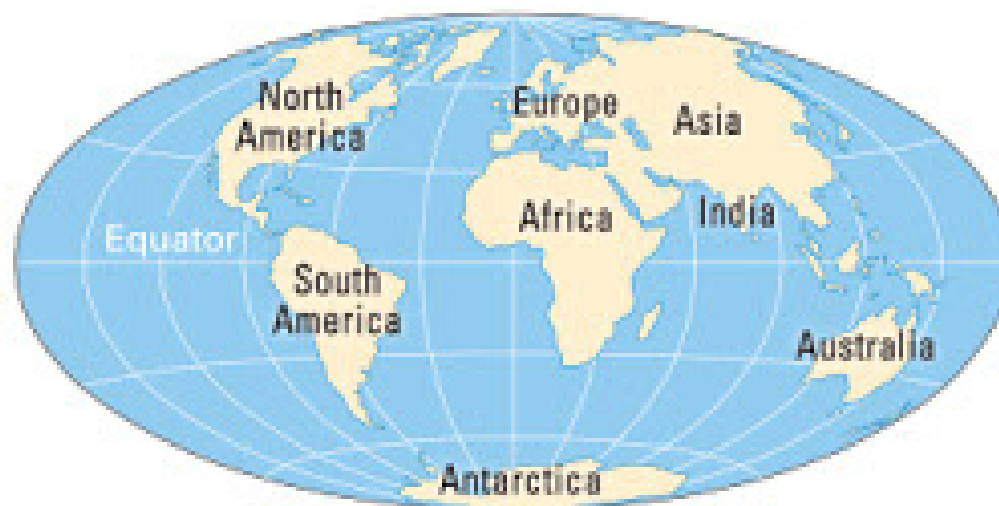
Tahap 4 : 65 juta tahun